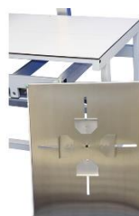
Zásuvka na kazetu se středěním