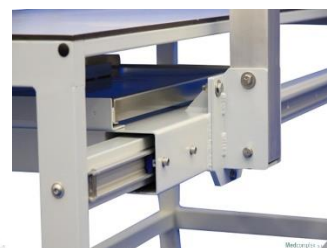
synchronní pojezdový mechanismus