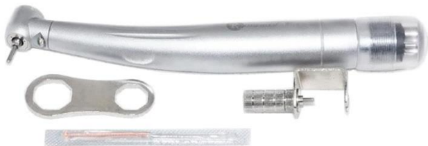
08-PP3 Turbínka s LED světlem 4 345 Kč