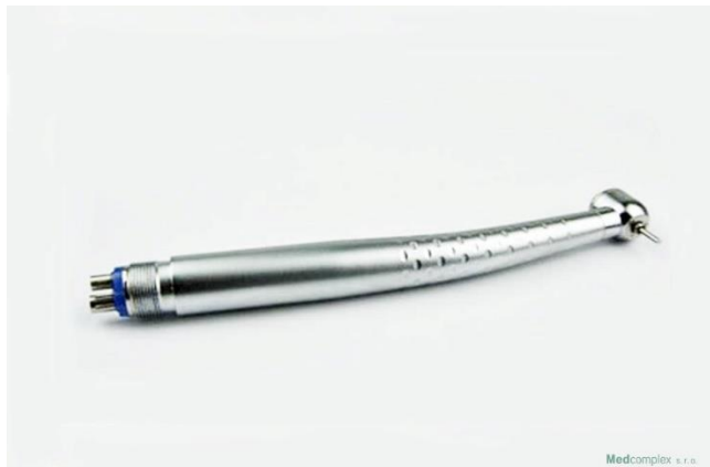
08-PP2 Turbínka 90 2 805 Kč