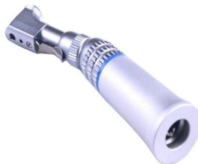
08-PP4 Kolíčko pro mikromotor 1 639 Kč